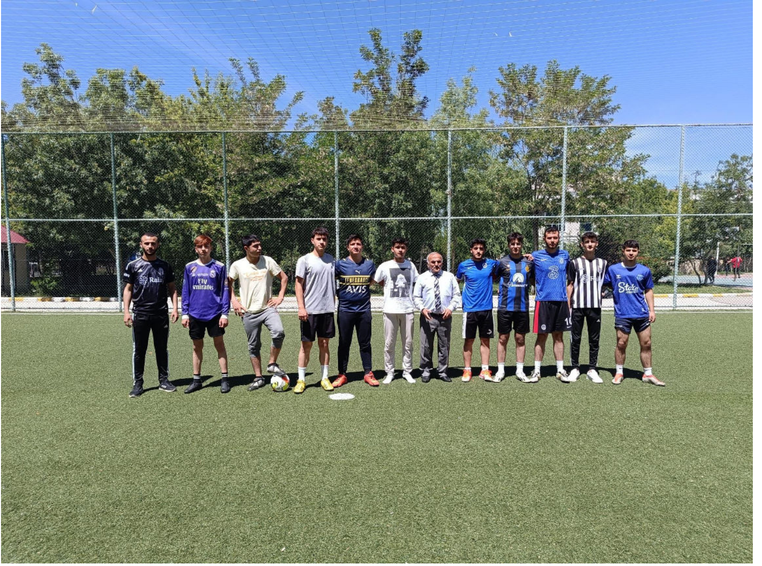
Okulumuz Futbol Takımı....